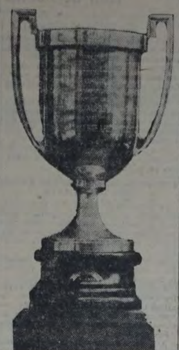
LA COPA QUE DISPUTAN ANUALMENTE LOS EMPLEADOS DE CORREOS DE AMBAS ORILLAS DEL PLATA