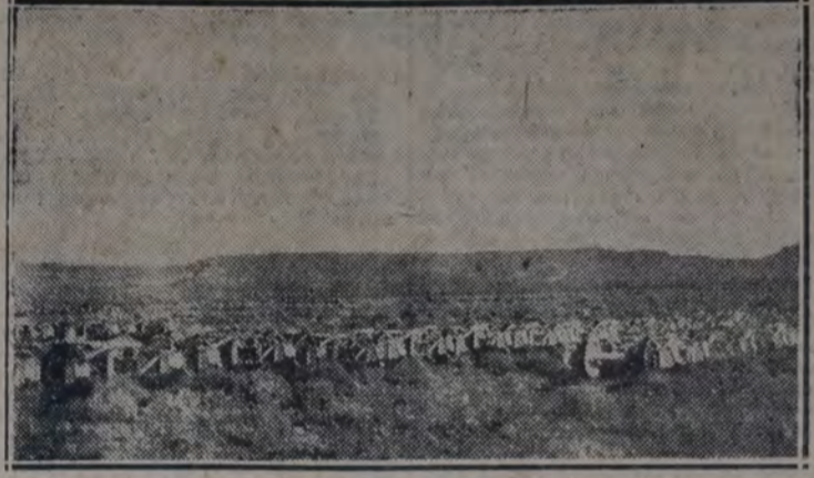
RÓDADOS COMPLETOS PARA VAGONES ABANDONADOS A LA INTemperIE