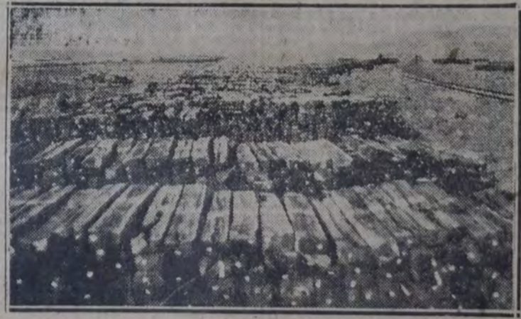
DURMIENTES AMONTONADOS, EXPUESTOS AL DETERIORO Y A LA SUBSTRACCION

bierno del señor Alvear, lejos de querer hacer luz en los escándalos cometidos en los FF. CC. del Estado, trata afanosamente de encubrir todo, ese correcto funcionario presentó su renuncia en abril de 1926. Al poco tiempo, "La Prensa" consiguió publicar un extracto concreto del informe sequestrado por el ministro Ortiz; en atención a sus gravísimas revelaciones, el diputado Oddone pidió en la sesión del 30 de julio de 1926, una investigación